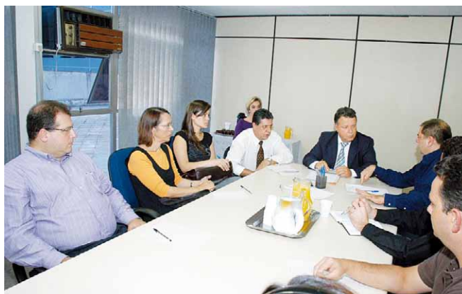
Reunião inicial no Instituto de Identificação

As assistentes sociais das prefeituras das cidades mais prejudicadas – Morretes, Antonina, Paranaguá e Guaratuba – foram aos locais onde estavam os desabrigados para que eles preenchessem os formulários de requisição da segunda via de certidões de nascimento e casamento.