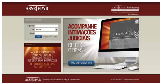
Site da Assejepar - www.assejeparintimacoes.com.br

O “Assejepar Intimações” oferece as informações de intimações publicadas no Diário Eletrônico do Paraná, Diário Oficial Eletrônico do Trabalho 9ª região, Diário Eletrônico da Justiça Federal 4ª Região – processos oriundos do Paraná, Diário Eletrônico Eleitoral do Paraná e Tribunais Superiores (STJ, STF, TST, CNJ, STM e TSE) com proces-