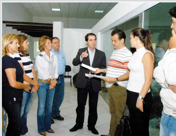
Trabalho do mutirão em Antonina