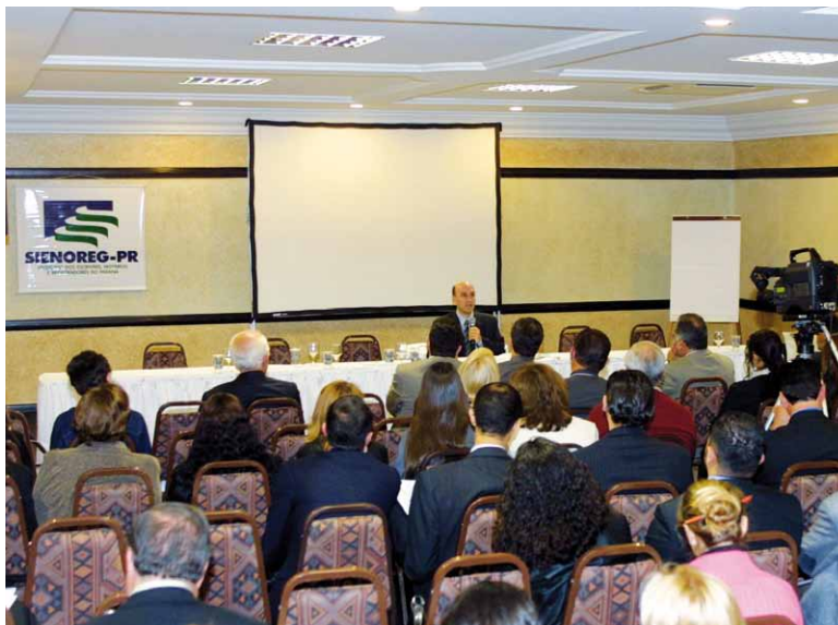
Encontros serão retomados em 2011

O objetivo do sindicato é realizar ao menos quatro eventos ao longo desse ano no Paraná.